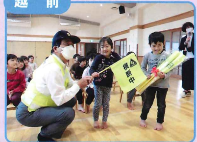
認定こども園での安全教室と横断小旗などの交通安全グッズの贈呈