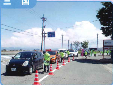
交通安全茶屋での広報啓発活動