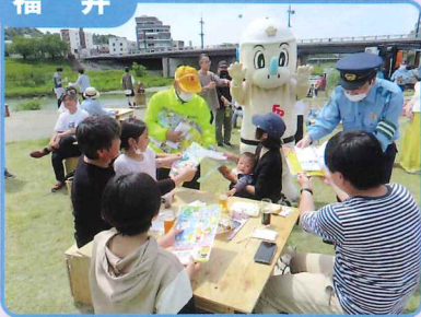
GW期間中に開催されたイベント会場で飲酒運転撲滅啓発活動