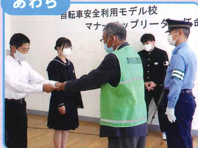
自転車利用モデル校での「マナーアップリーダー任命式」