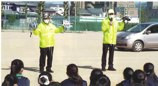
ヘルメット・自転車保険・自転車点検などの重要性を高校生等に講習

福井県交通安全協会では、昨年度に引き続き令和5年度も福井県警察及び福井県保険代理業協会と連携し、県内の高等学校や特別支援学校等を巡回し自転車安全利用促進に向けた啓発活動を実施しています。巡回活動ではヘルメットの着用の重要性に併せ、自転車用ヘルメットや事故抑止に繋がる安全グッズの紹介を行っています。