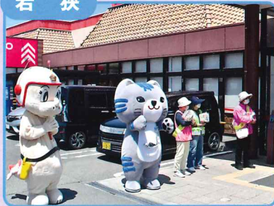
ゆるキャラも参加しての国道27号交通死亡事故ゼロ啓発活動