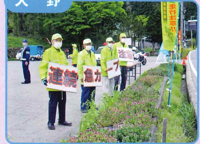
GW期間中事故多発区間での街頭啓発活動