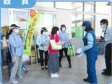
量販店での交通安全啓発活動