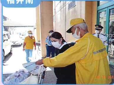
量販店での交通安全啓発活動