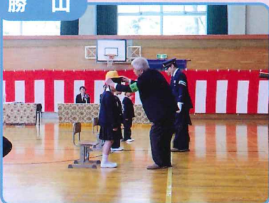
小学校入学式で新生児に交通安全帽子を贈呈