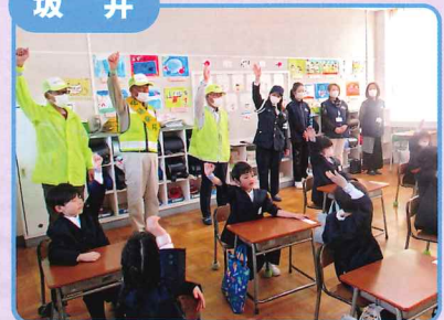
小学校での「命を守る交通安全教室」で児童と一緒に体験型教室に参加