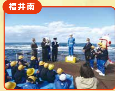
福井南 「浜のお巡りさん」リニューアル