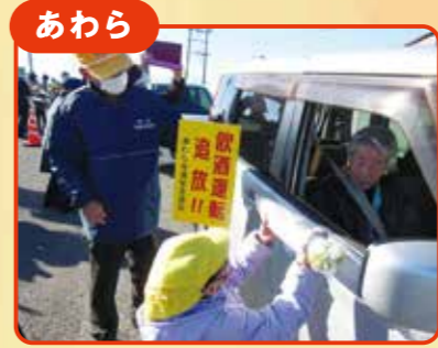
あわら 「飲酒運転“大根”絶」交通安全茶屋