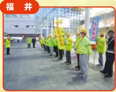
福井 交通事故抑止活動