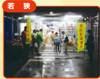
若狭 交通安全啓発活動