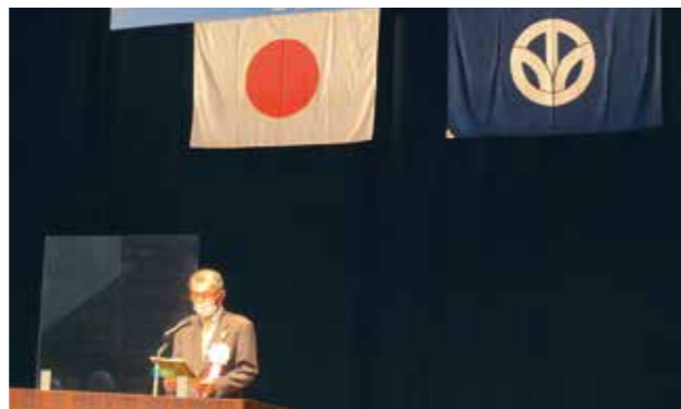
東川あわら交通安全協会長の大会宣言