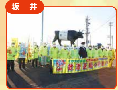
坂井 ピカっと光って“もー”安心