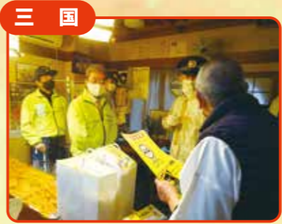
三国 「なくそう飲酒運転」飲食店へマスク配布