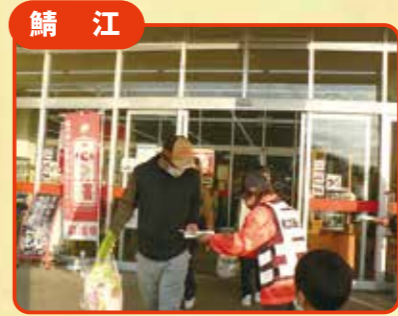
鯖江 量販店での交通安全啓発活動