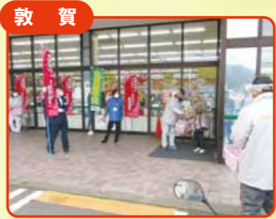
敦賀 飲酒運転撲滅キャンペーン