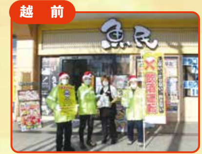
越前 飲酒運転根絶活動